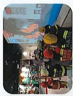
對模擬火災的警導進行派火，學習滅火器的正確操作方式與滅火要點。