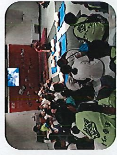
CPR結合AR即時回饋，透過救護人員講解與示範，學習正確的心肺復甦法與AED操作。