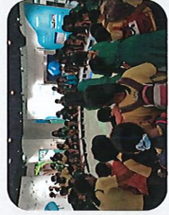
透過桃園地景光雕，認識桃園的自然環境、人文活動以及潛在危害。